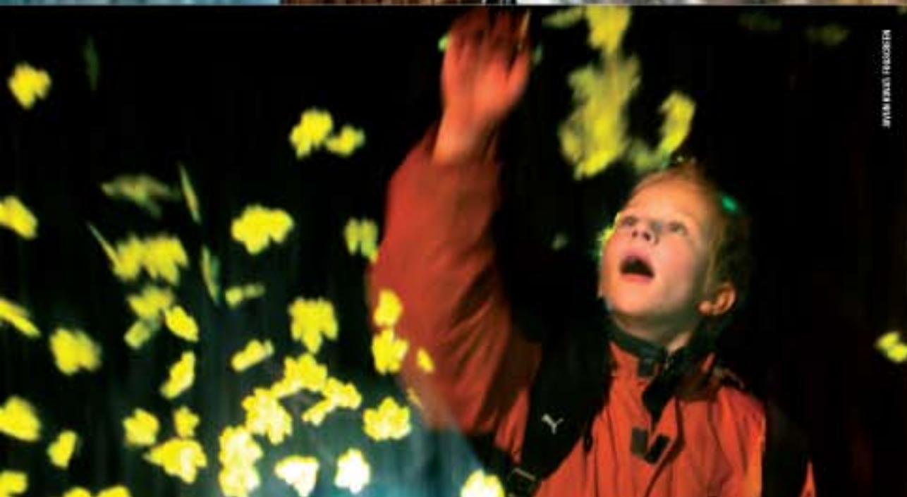
Illustration: Mikko Vartiainen.