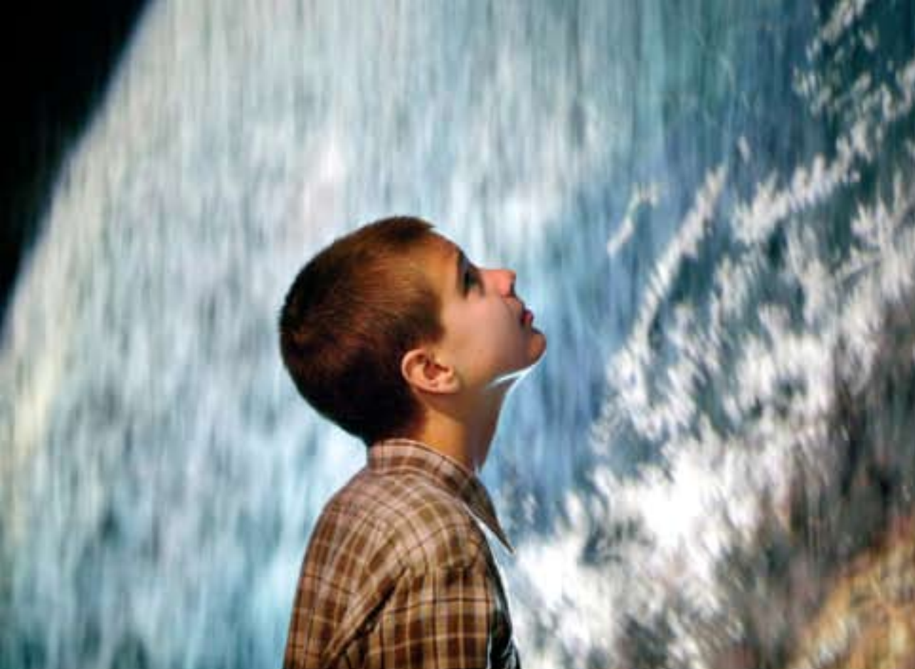
Illustration: Mikko Vartiainen. Kuvassa nähdään digitaalisen taiteen esittämistä mahdollisuuksista.